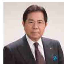
株式会社エーデルワイス 会長