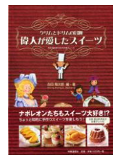
著書:『偉人が愛したスイーツ』

1944年東京都生まれ。明治大学卒業後渡仏、製菓修行。第1回菓子世界大会銅賞、現代の名工受賞など、数々の国内外の賞を受賞。日本に本格的な洋菓子を広めた“洋菓子の父”と呼ばれている。