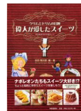
著書:『偉人が愛したスイーツ』

1944年東京都生まれ。明治大学卒業後渡仏、製菓修行。第1回菓子世界大会銅賞、現代の名工受賞など、数々の国内外の賞を受賞。日本に本格的な洋菓子を広めた“洋菓子の父”と呼ばれている。